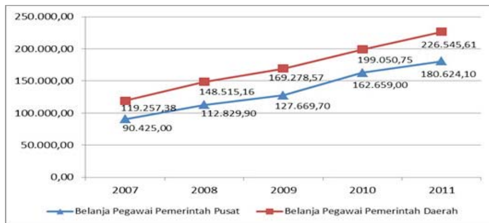
Grafik 3. Belanja Pegawai Pemerintah Pusat dan Pemerintah Daerah